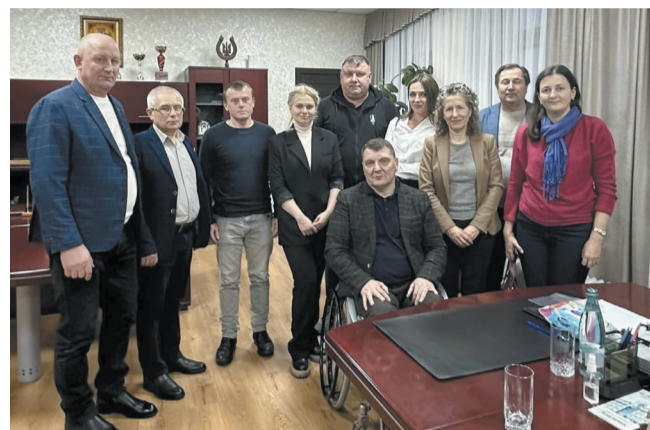
Партнери зі Швейцарії