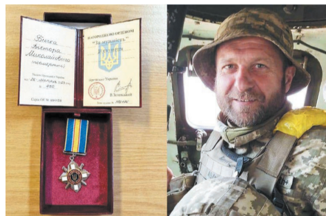
«За мужність» - навічно