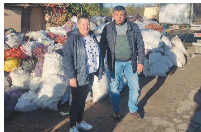
Хмільничани - Херсону