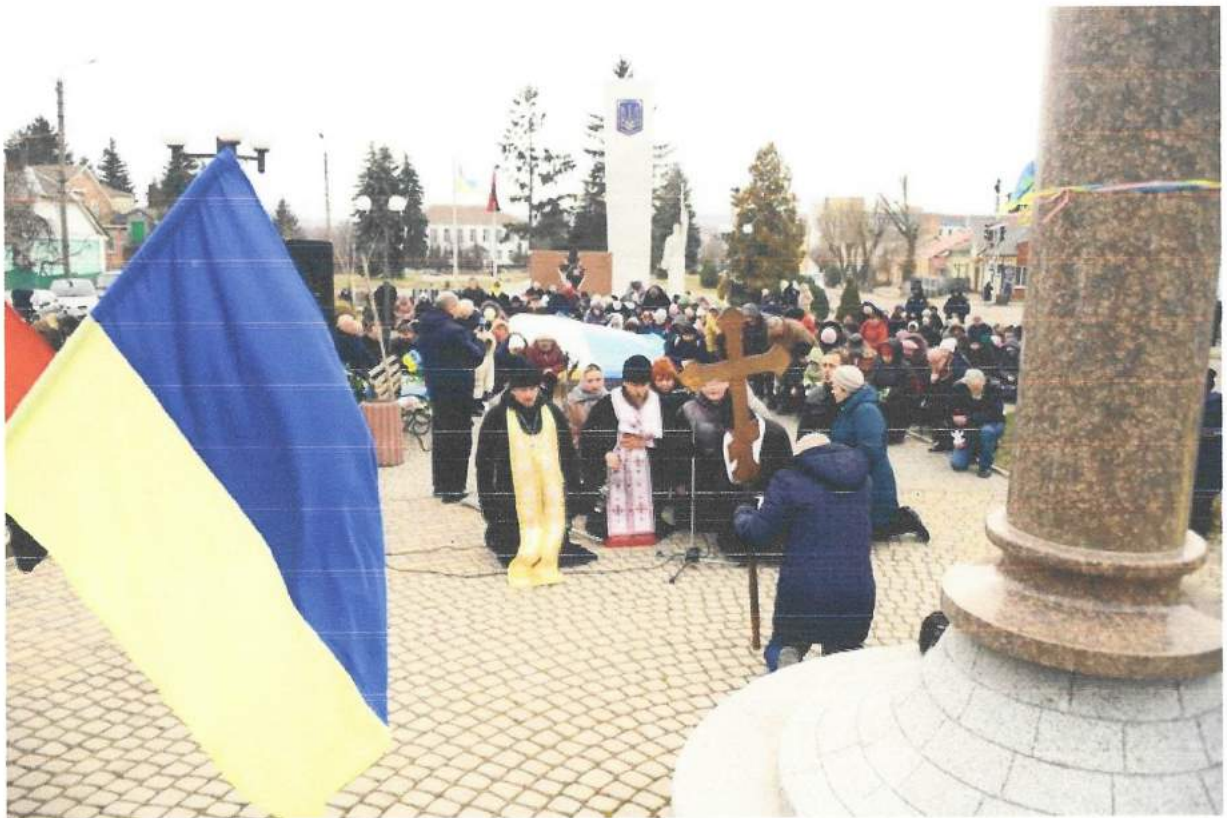
Хвилиною мовчання хмельничани вшанували тих, хто загинув у Києві під час Революції Гідності.